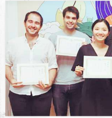
#Fin de curso