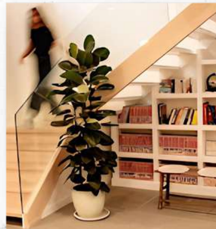
#Sesiones de estudio en la biblioteca