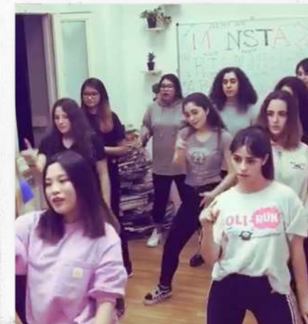
#Baile de Kpop